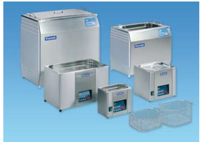
Kemet (科密特)超声波洗净装置