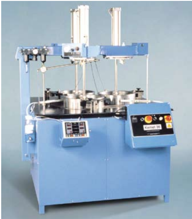
Kemet (科密特)36研磨及抛光机(Kemet 36 Lapping And Polishing Machine)为多种金属、光学玻璃、陶瓷及其它材料提供高精度平面及表面处理。是一种经济，可靠的机型和附上金刚石研磨系统配件共同使用。