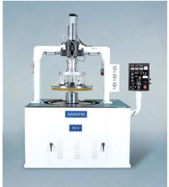
Nanofin精密双面研磨及抛光机(Nanofin Dual Face Grinding, Lapping And Polishing Machine)除能在范围广泛的材料上制造精密和重复一致的加工效果外，还能执行复杂的常规操作。